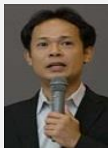
ココラット ドキュメンタリー監督 在日ビルマ人